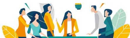
Table ronde « Quels dispositifs judiciaires pour mieux protéger et accompagner les enfants victimes de violences conjugales ? »

Description: Stand avec animation autour des violences