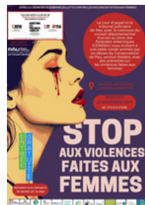
Table ronde violences faites aux femmes